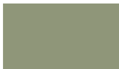
5808 iceberg green