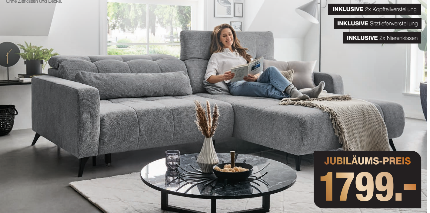
INKLUSIVE 2x Kopfteilverstellung