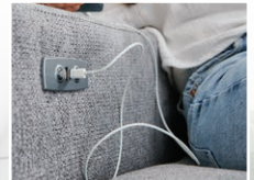
INKLUSIVE USB-A und -C Anschlüsse.