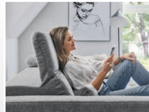
INKLUSIVE manueller Kopfteilverstellung.