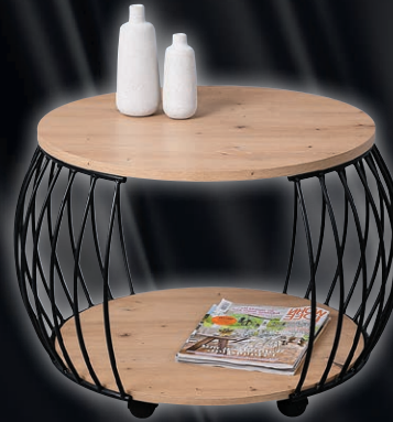
Couchtisch, Eiche Artisan Nachbildung, Metallgestell schwarz, auf Rollen, Ø/H: ca. 60x47 cm.