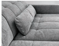
INKLUSIVE perfekter Unterstützung: Bequeme Nierenkissen.

Eckkombination, Bezug Stoff Aragon hellgrau, 95% Polyester, 5% Nylon, Metallfuß schwarz matt gepulvert, best. aus: 2-Sitzer mit Armteil links und Ottomane mit Armteil rechts, inklusive 2x manuelle Kopf- teilverstellung, 2x Nierenkissen und motorischer Sitztiefenverstellung , Stellmaß: ca. 277x203 cm. Ohne Zierkissen und Decke.