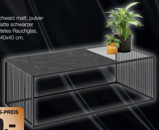
Couchtisch, Metallgestell schwarz matt, pulver- beschichtet, Platte schwarzer Marmor, gehärtetes Rauchglas, B/H/T: ca. 80x40x40 cm.