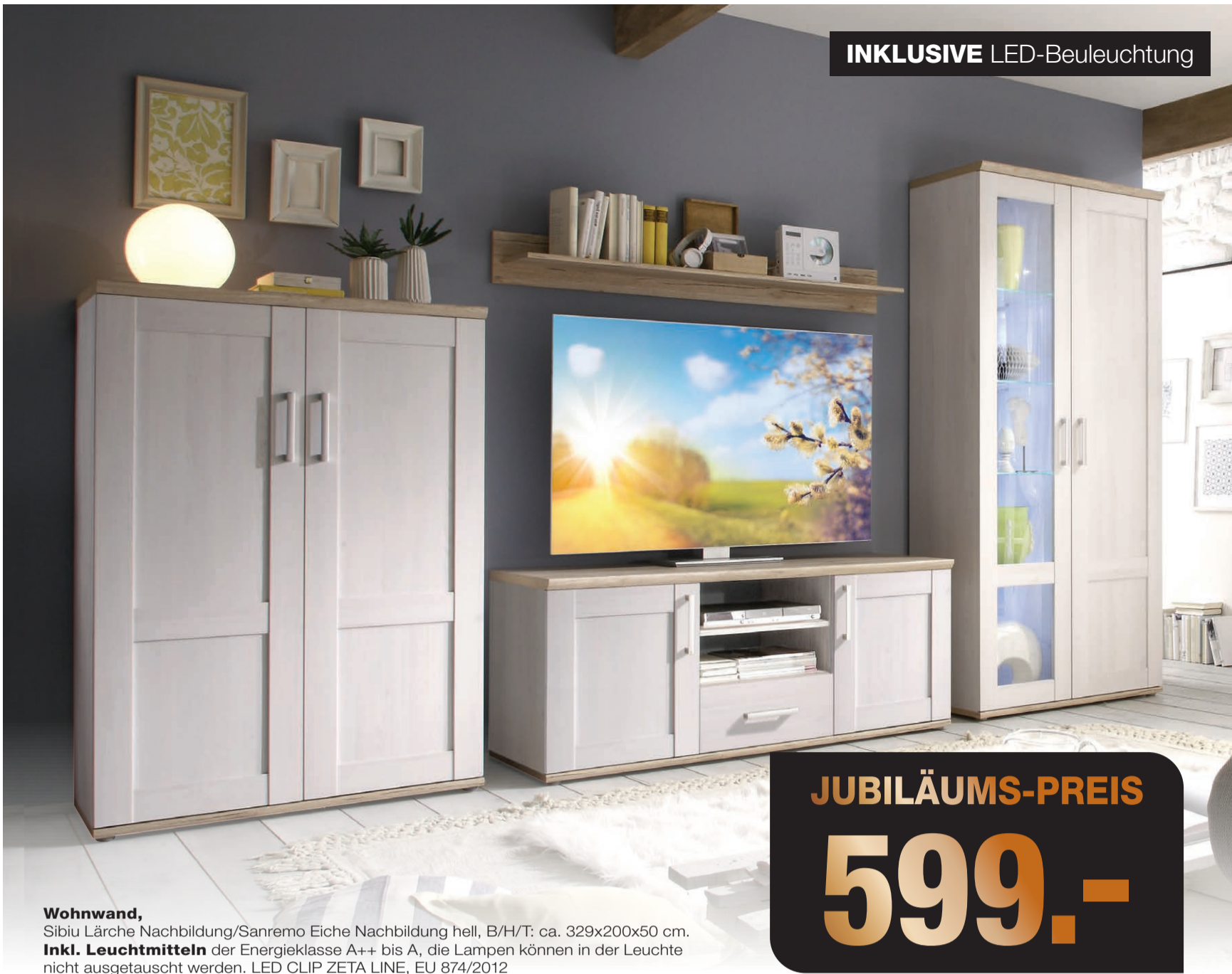
Wohnwand, Sibiu Lärche Nachbildung/Sanremo Eiche Nachbildung hell, B/H/T: ca. 329x200x50 cm. Inkl. Leuchtmittel der Energieklasse A++ bis A, die Lampen können in der Leuchte nicht ausgetauscht werden. LED CLIP ZETA LINE, EU 874/2012