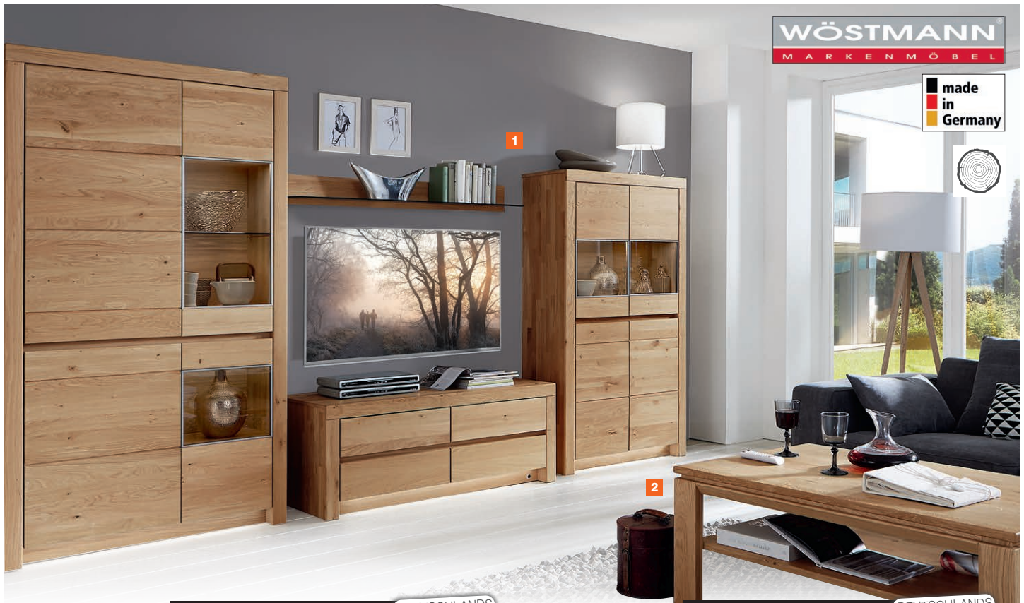
1 Wohnwand, Wildeiche massiv, B/H/T: ca. 377x201x23-52 cm.

4999.- DEUTSCHLANDS BESTER PREIS 2) WESER WOHNWELT