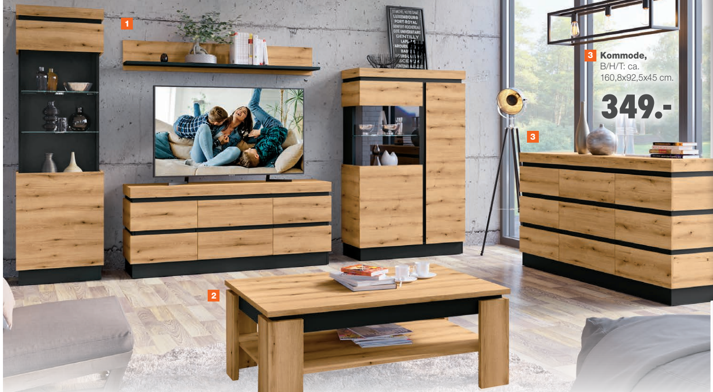
1 Wohnwand, B/H/T: ca. 324x200x45 cm.

779.- DEUTSCHLANDS BESTER PREIS 2) WESER WOHNWELT